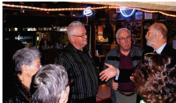
Photo : L'intérêt des aînés pour les présentations sur l'abus et la fraude est manifeste : rassemblement au Club Richelieu à Embrun le 23 avril 2013. Source : Club Richelieu

Les Gilles Blache et Jean-Claude Bernais, tous deux bénévoles « champions » de la FAAFC, ont animé un webinaire de la Fédération des aînés et retraités de l'Ontario (FAFO) sur les meilleurs outils de prévention de la fraude pour les aînés le 25