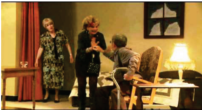
Photo : Trompe-l'heure et tromperies , une pièce de Michel Ouellette, est un des outils de sensibilisation utilisés dans les communautés.

La Fédération des aînés franco-albertains (FAFA) a battu campagne sur les ondes et dans les journaux autour de la Semaine nationale de sensibilisation aux victimes d'actes criminels en avril dernier. Des émissions sur la maltraitance et l'abus envers les aînés ont été diffusées, de même que des messages ont été publiés dans les médias écrits pour sensibiliser la population francophone à ce sujet. Poursuivant sa collaboration avec l'Association des juristes d'expression française de l'Alberta (AJEFA), la FAFA prévoit tenir une quinzaine de journées de sensibilisation faites sur mesure,