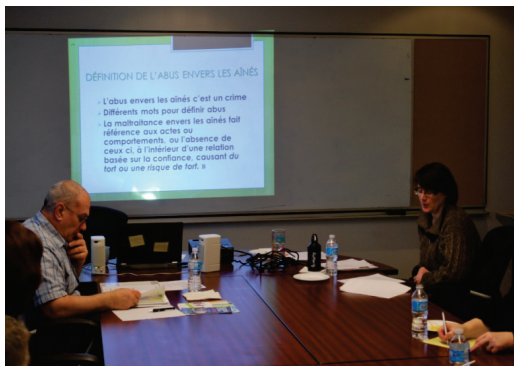
Photo : L'atelier de formation tenu le 12 mars dernier au club Les Débrouillards. Source: FFTNL

radio comme médium avait déjà été réalisée avec succès dans le passé. Cette année, l'élément nouveau a été l'utilisation de la formule vox pop. Cette formule a permis aux gens d'exprimer leurs opinions sur la problématique des abus et de la fraude aux aînés. Par ailleurs, le club des aînés Les Débrouillards a reçu une formation par le biais des capsules théâtrales de la FAAFC. La formation consiste non seulement à la projection des capsules, mais aussi à des discussions qui sont animées par une personne bénévole.